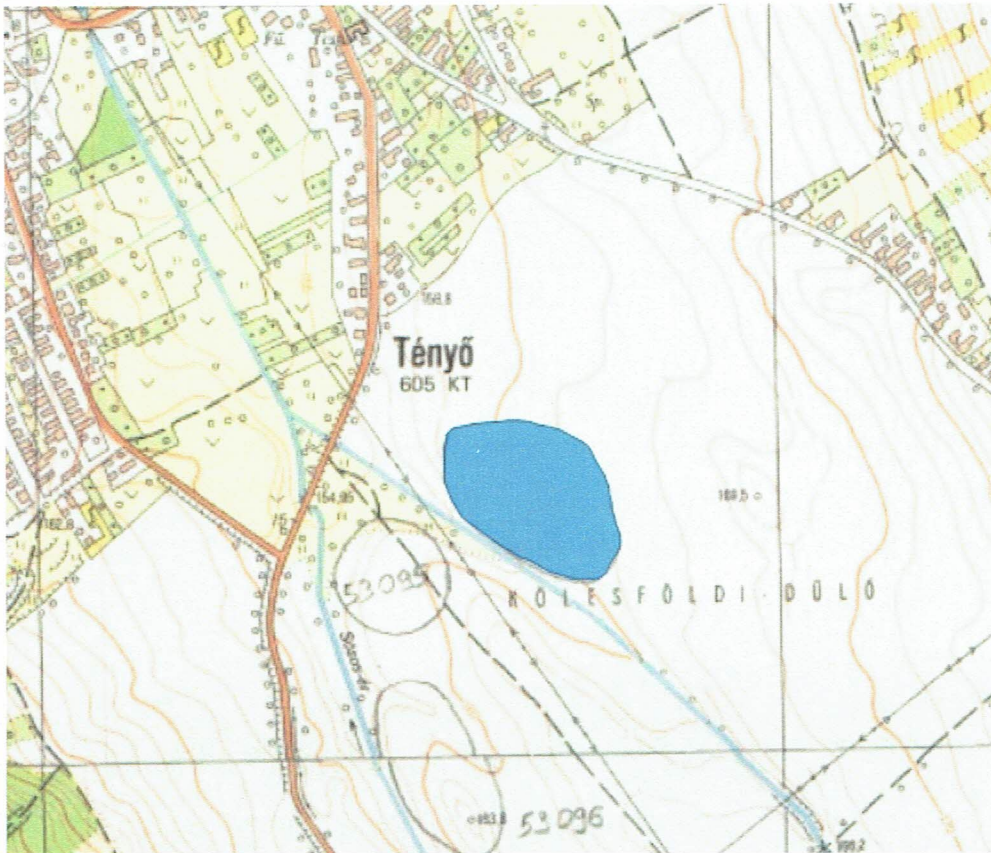
Kenderföldi-dűlő III. lelőhely, megnövelt kiterjedéssel