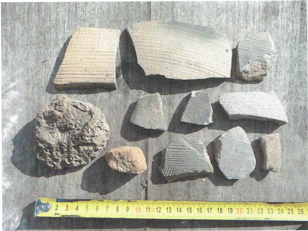
A terepbejárás során előkerült cserepek és salak