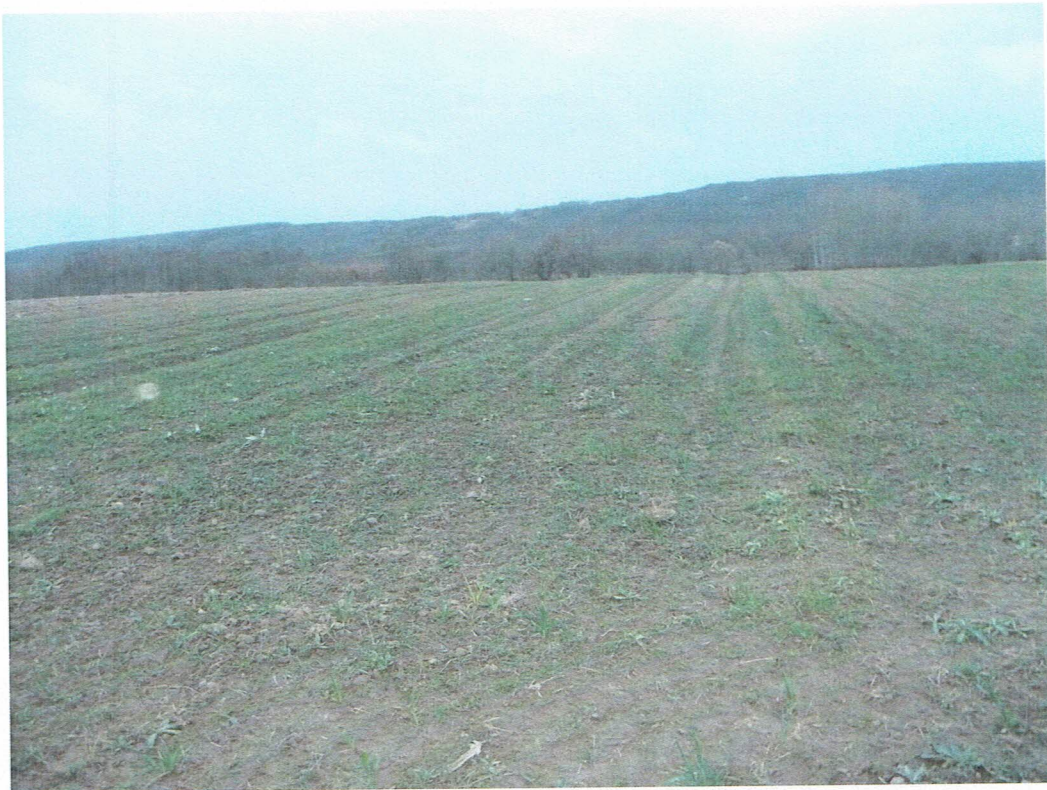
A vizsgált terület keletről tekintve