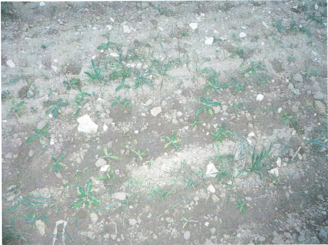
A homokkőfoltok egyike