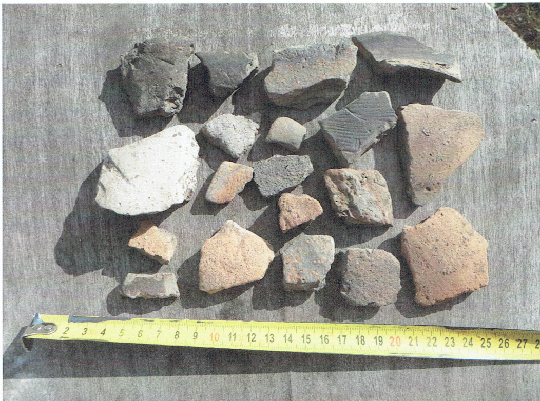
A terepbejárás során előkerült kerámiatöredékek