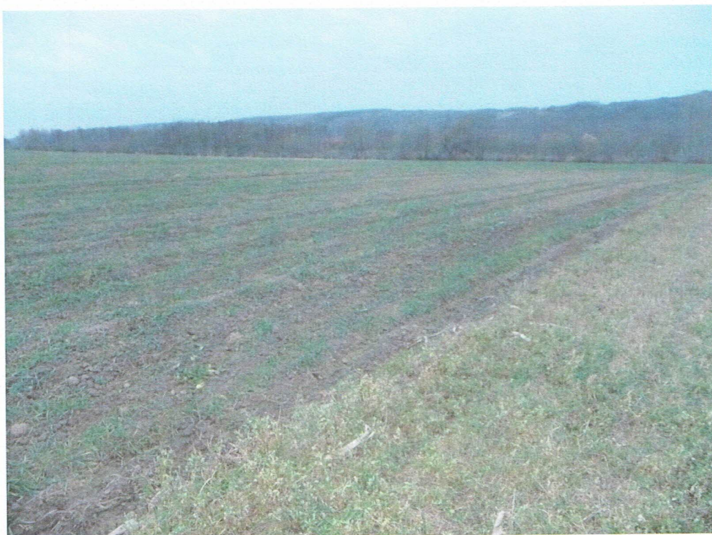
A lelőhely északról, a lucernástól