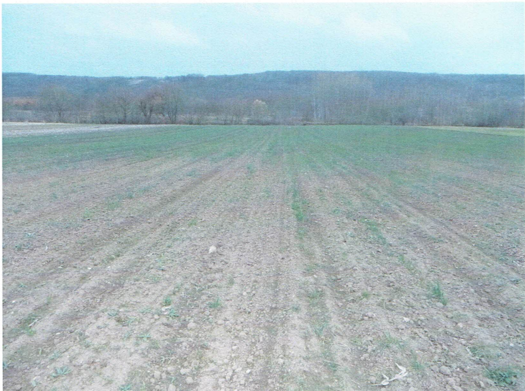
A lelőhelyet rejtő dombhát